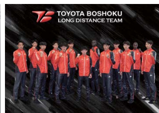
トヨタ紡織(愛知県刈谷市)