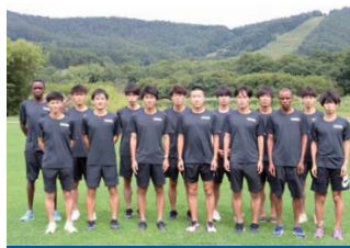
愛知製鋼(愛知県東海市)