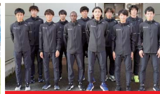
セキノ興産(新潟県見附市)