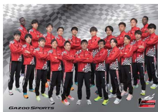
トヨタ自動車(愛知県田原市)