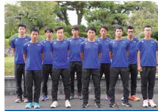
御殿場滝ヶ原自衛隊(静岡県御殿場市)