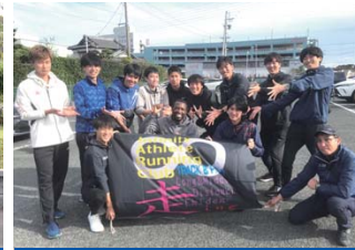
Infinity Athlete & Running Club(愛知県刈谷市)