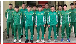
高田自衛隊(新潟県上越市)