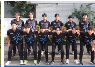
トーエネック(愛知県名古屋市)