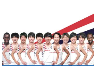
中央発條(愛知県名古屋市)